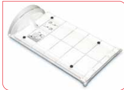
Der hochwertige Klappmechanismus garantiert eine lange Lebensdauer.

Das Stadiometer seca 417 ist ideal für den mobilen Einsatz, um den Ernährungs- und Entwicklungsstand von Säuglingen und Kleinkindern z.B. bei Reihenuntersuchungen zu überprüfen. Denn gerade hier ist es wichtig, dass die Messergebnisse leicht und schnell abgelesen werden können. Das gewährleisten rote Ablesemarken und eine hochwertige Skalenbedruckung, die auch nach Jahren intensiven Gebrauchs nicht verblasst.