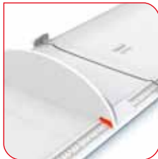
Auf der großen Skala lässt sich der Messwert schnell ablesen.

Das zweigeteilte Messbrett seca 417 wird über ein Scharnier aufgeklappt. Es verfügt über einen integrierten Kopfanschlag und einen separaten Fußanschlag, der auf einer sanft erhöhten Führungsschiene leicht und präzise bewegt werden kann. Zum Messen genügt es, den Kopf des Kindes am Kopfanschlag auszurichten, die Beine vorsichtig zu strecken und den Fußanschlag an die Füße zu führen.