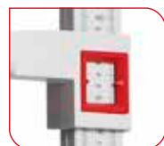
Zwei große Ablesefenster und beidseitige Skala für leichtes Ablesen.