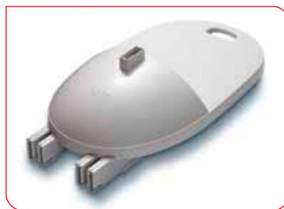
Integrierter Griff und sichere Arretierung aller Einzelteile für leichtes Tragen.