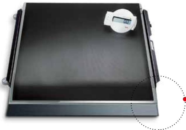
Im Lieferumfang ist eine Rampe zum leichten Auffahren von Rollstühlen enthalten.